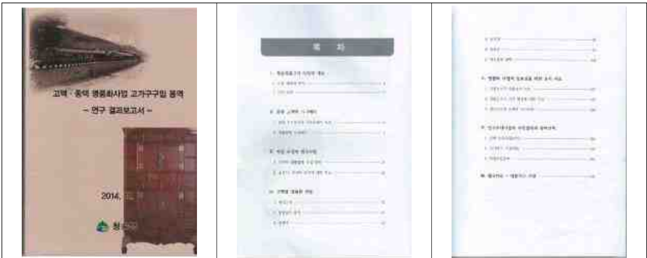
청송명품고가 구성을 위한 조사연구 : 2014. 11